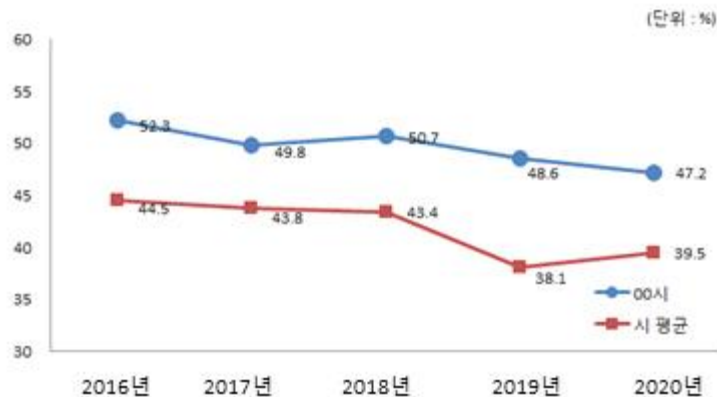
유형 지방자치단체와 재정자립도 비교