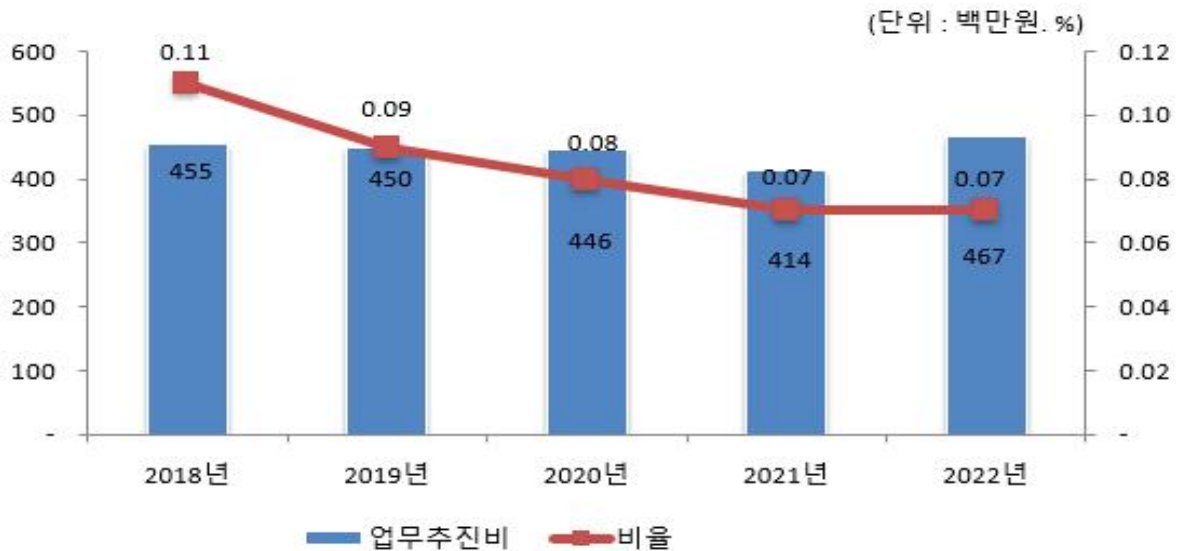
업무추진비 연도별 변화

☞ 매년 총액한도 산정방법에 따라 총액한도를 설정하고 한도액 범위내에서 지급대상과 금액을 편성하고 집행함