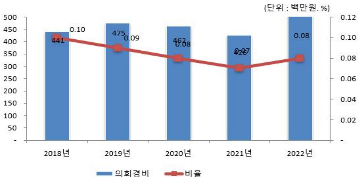
의회경비 연도별 집행액 및 비율 변화