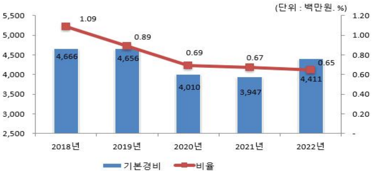
기본경비 연도별 변화

☞ 코로나19 등 출장 감소에 따른 국내여비 및 행정경비 지출감소로 기본경비 감소